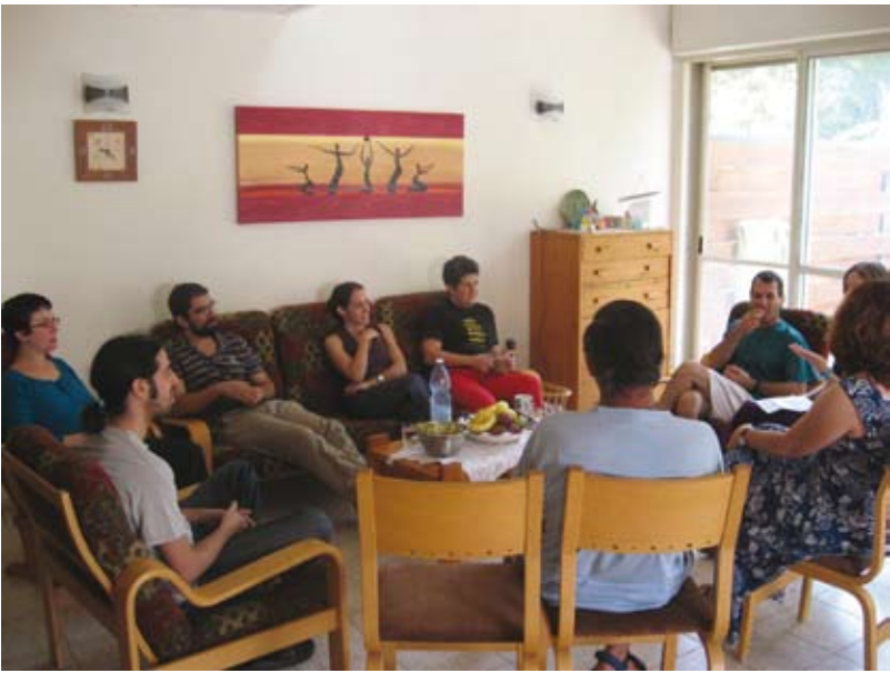
כנס של מעגל הקבוצות. התחדשות הרעיון והמעשה השיתופי

קיומן של הקבוצות השיתופיות מפריך את הטענה הדטרמיניסטית לפיה "הצעירים לא רוצים קיבוץ". יש לחתור לתנועה שיתופית לשינוי החברה הישראלית על בסיס המטה השיתופי, תנועות הבוגרים ומעגל הקבוצות