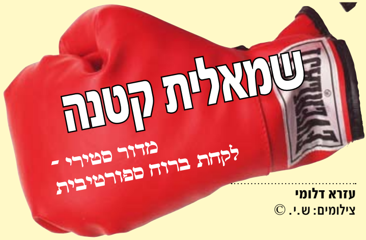
עזרא דלומי