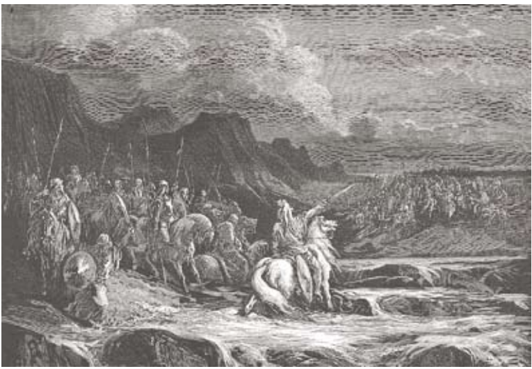
יהודה המכבי: קנאי דתי או מהפכן חברתי? (איור: גוסטב דורה)

איזה סיפור חנוכה נרצה? של פנאטיות דתית? של נסים אלוהיים? כדאי להזכיר שהמתיוונים היו עשירים בני המעמד הגבוה והמכבים, לעומתם, היו בני המעמד הפשוט, איכרים מן הפריפריה. חנוכה מזכיר לנו שבעלי הממון והשררה אינם בלתי מנוצחים