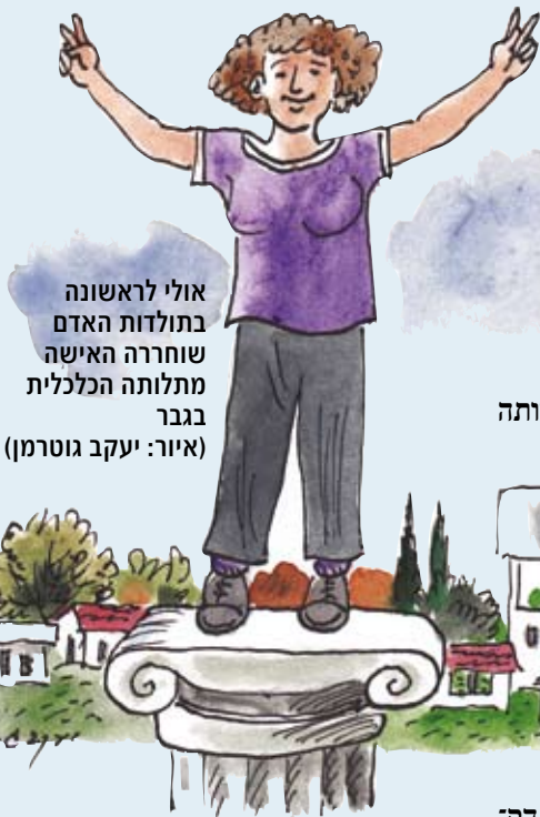
אולי לראשונה בתולדות האדם שוחררה האישה מתולת הכלכלית בגבר