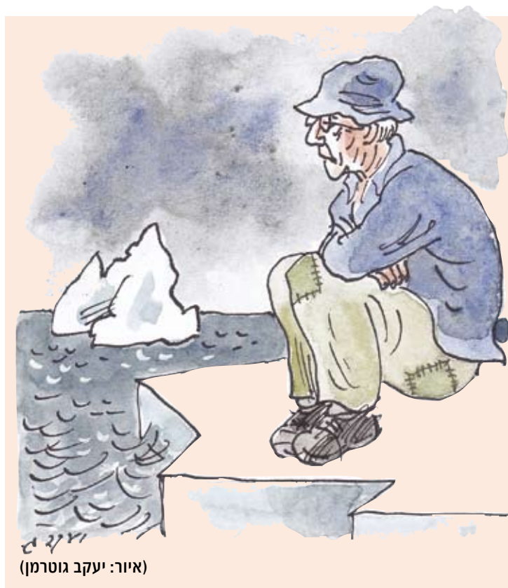
(איור: יעקב גוטמן)