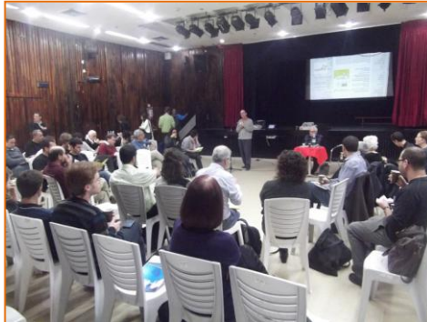
מרצים – יהודה פז ורייפי גולדמן ממכון אג'יק בנגב חוג דיון במסגרת יום העיון.