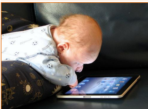
עימות חזיתי מאפייני דור ה-Y לעומת דור המעסיקים