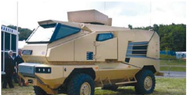
התעשיות הכי מצליחות בארץ, הרכבים הממוגנים מתוצרת פלטסאס

הקיבוץ החלוץ, המורד, לא היה לטעמם של אבני וחבריו. זה תמציתו של המשבר. במקום להוביל את המאבק נגד הריקבון בחברה הישראלית, הם מבקשים להשתלב בו. בעשירון העליון שלו. לא ממש מפריע להם להשאיר בשולי הדרך את החלשים, העשירון התחתון. כך בחברה הישראלית וכך בקיבוץ