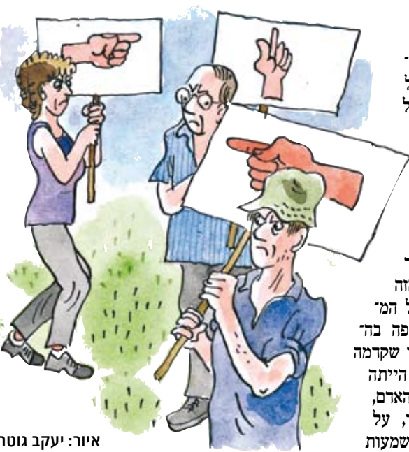
איור: יעקב גוטרמן

באופן פרדוקסאלי, שיכול היה אולי להיות מצחיק, בקיבוץ מתקיימות זו לצד זו כל התפיסות הנזכרות כאן. גם סוציאליזם, גם ליברליזם, אבל גם פיאודליזם מטריד: ישנם יותר מדי חברי קיבוץ - גם בקיבוצים השיתופיים - הסבורים שהמקרה שלהם מצדיק 'פריבילגיה'. לא במקרה