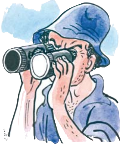
איור: יעקב גוטמן

המתנגדים לשינוי דיפרנציאלי בקיבוץ ציטוטים יודעים היטב את חולשותיו של הקיבוץ השיתופי. הררי נייר הוקרשו במהלך השנים לניסיון להביא את חולשותיו של הקיבוץ המסורתי. רבים מחפשים, ולעיתים גם מוצאים, דרכים כיצד להתגבר על חולשות אלה בדרך שאינה שופכת את התינוק יחד עם המים.