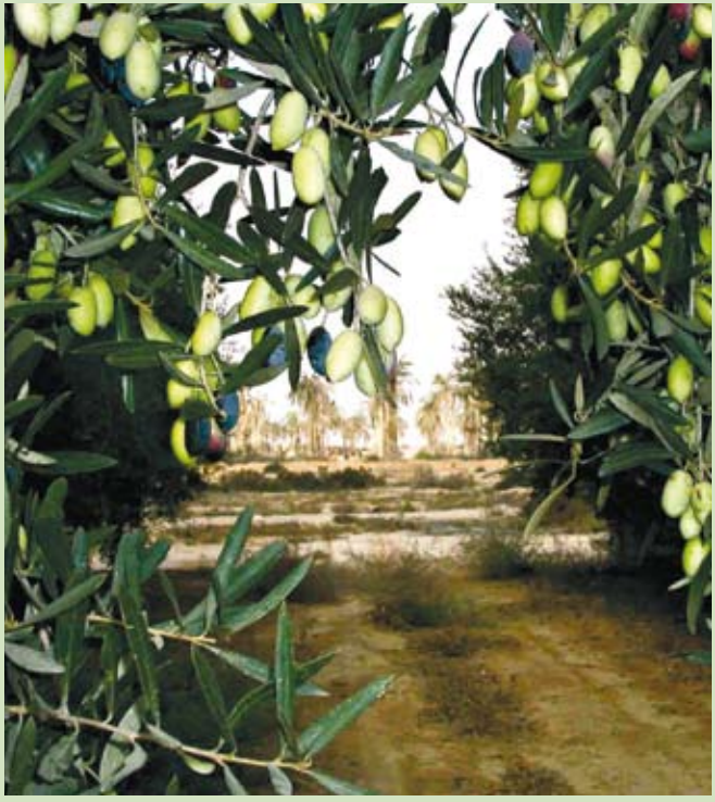
רמת הנגב מייצרת 10% מתצרוכת שמן הזית בארץ, כרם זיתים ותמרים בנגב