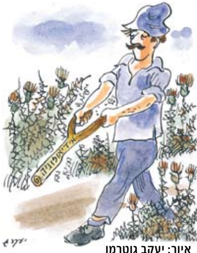
איור: יעקב גוטרמן

אמרתו הקלאסית של הרצל: "אם תרצו, אין זו אגדה", מדגימה להפליא את גישתה של תנועה מודרנית. מפעלו של אליעזר בן יהודה להחייאת השפה