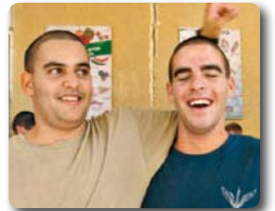
"למרות כל השוני, ישנם דברים רבים המאחדים אותנו", חברי גרעין נהר

טרנד חדש פורח היום בקרב מסיימי שנת השירות הקיבוצית בדמות גרעיני בני קיבוצים, המבקשים להמשיך להשפיע ולהעמיק את הקשר ביניהם, כמו גם את הקשר לתנועה הקיבוצית. חמישה גרעינים ייכנסו לשל"ת במהלך אוגוסט בסמר, לוטן, יהל, יזרעאל וניר-עוז. הגרעין הראשון נהר כבר נקשר לזיקים